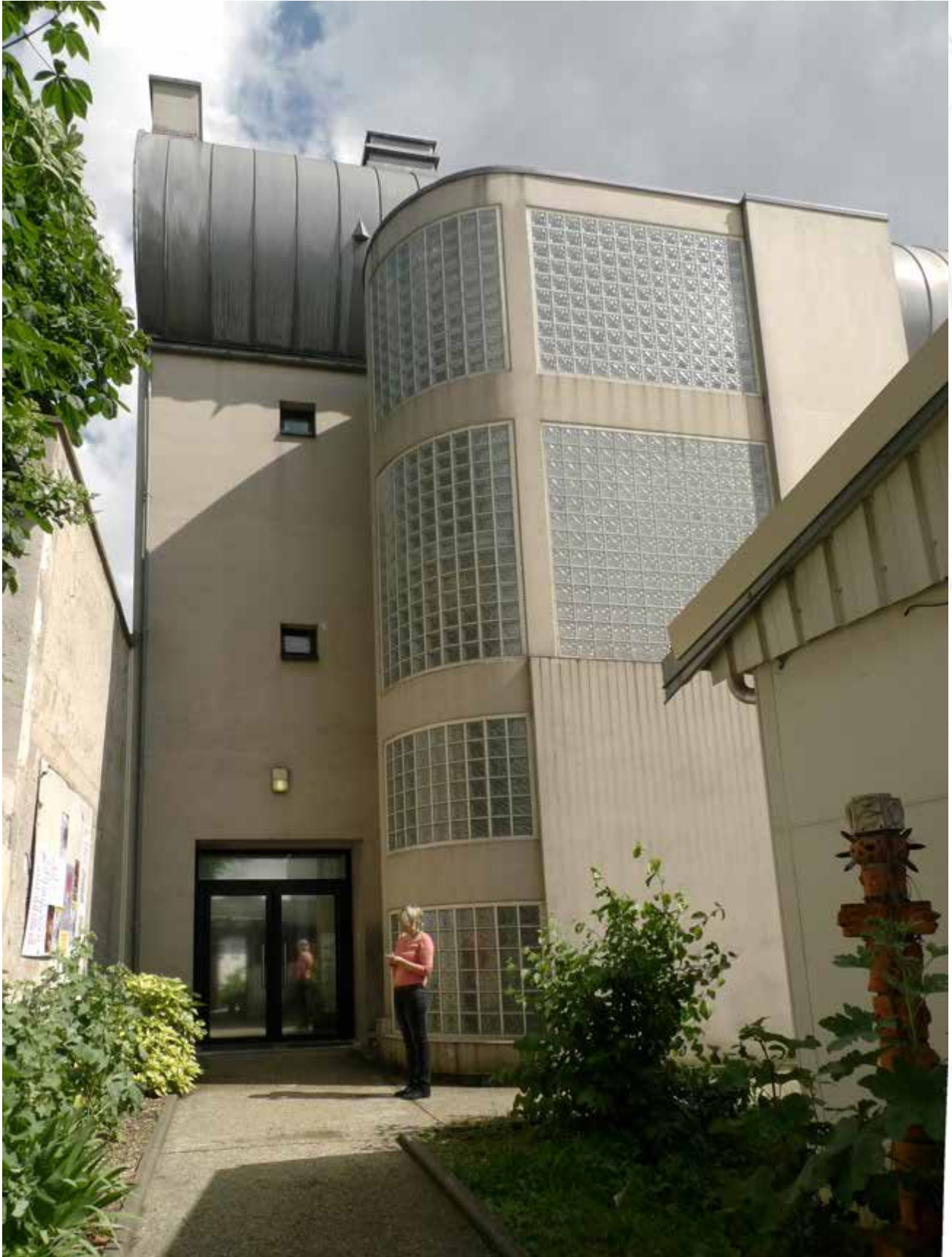
Photographie N°1 : Façade extérieure du Centre d'art (entrée principale de la Maison populaire côté rue Dombasle)