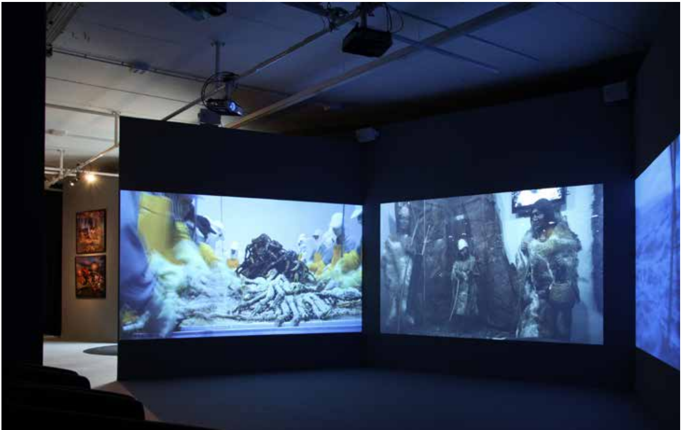
Photographie N°1 : © Aurélie Cenno - Exposition « L'Autre... De l'image à la réalité 1/3 : vers l'Autre » de Blandine Roselle, Maison populaire, 2017 Photographie N°2 : © Aurélie Cenno - Exposition « L'Autre... De l'image à la réalité 1/3 : vers l'Autre » de Blandine Roselle, Maison populaire, 2017