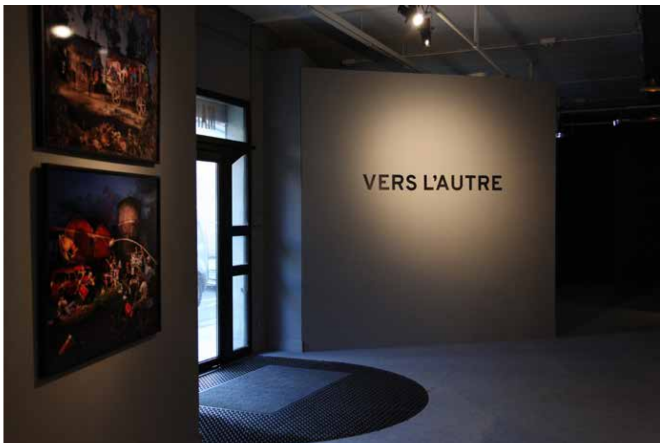
Photographie N°3 : © Aurélie Cenno - Exposition « L'Autre... De l'image à la réalité 1/3 : vers l'Autre » de Blandine Roselle, Maison populaire, 2017 Photographie N°4 : © Aurélie Cenno - Exposition « L'Autre... De l'image à la réalité 1/3 : vers l'Autre » de Blandine Roselle, Maison populaire, 2017