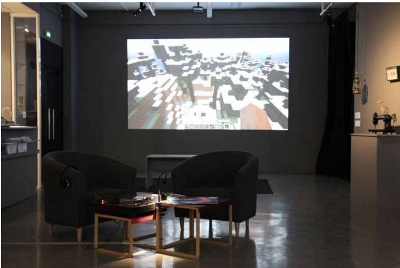
Photographie N°5 : © Aurélie Cenno - Exposition « L'Autre... De l'image à la réalité 1/3 : vers l'Autre » de Blandine Roselle, Maison populaire, 2017 Photographie N°6 : © Aurélie Cenno - Exposition « Comment bâtir un univers qui ne s'effondre pas deux jours plus tard 1/3 : Simulacres » de Marie Koch et Vladimir Demoule, Maison populaire, 2016