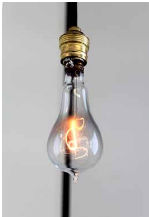
Maxime Bondu The Bulb of Livermore , 2012. Installation, documents, ampoule faite main Dimensions variables