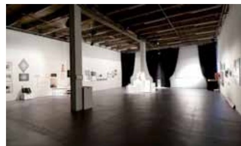
Vente aux enchères