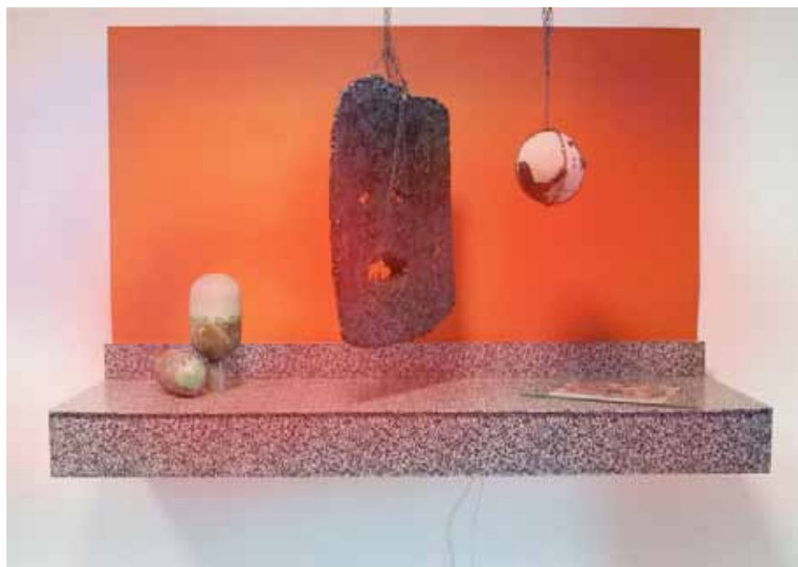
Laura Gozlan Underworld Plaza , 2014 Installation in situ, matériaux mixtes, dimensions variables