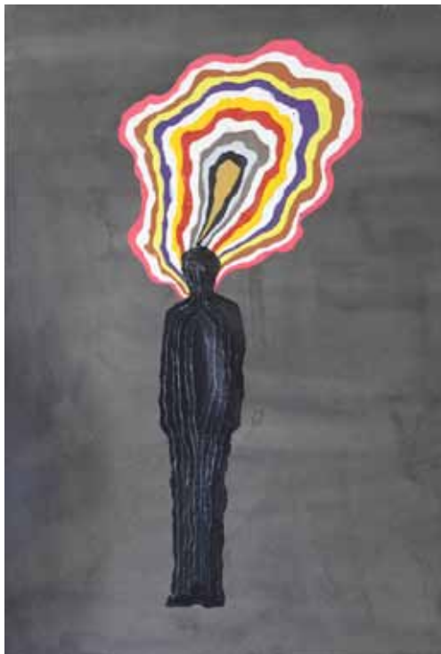
Xiang Liqing 向利庆 Rainbow , 2012 Acrylique sur papier, 39 x 27 cm, 2011