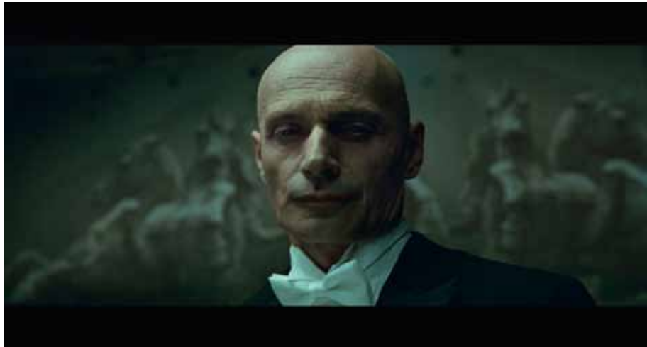
Denis Villeneuve Next Floor , 2008, film 35mm, 11min34s