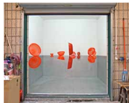
Butterfly , Xu Zhifeng Bazaar Compatible program #8, 2012

Paul Devautour a créé en 2008, « XiYiTang », une école internationale d'études post-grade en art, à Shanghai, devenue l'Ecole Offshore de l'Ecole Nationale Supérieure d'Art de Nancy.