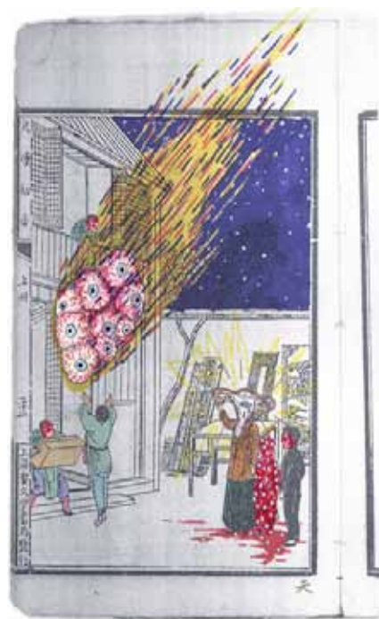
Tianzhuo Chen 陈天灼 The Great Evidence , 2014 Photocopies de dessins au feutre marqueur, 42cm x 29,7 cm Courtesy de l'artiste