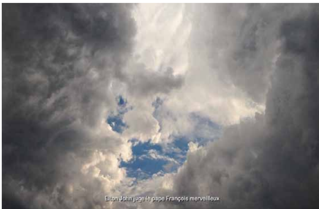
Thierry Fournier Précursion , 2014 Installation en réseau Création en résidence