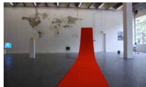
Exposition Opération Tonnerre

Mains d'Œuvres soutient l'art contemporain par l'intermédiaire d'un programme de résidences d'artistes émergents et d'une programmation d'expositions et d'événements. En plaçant les artistes au coeur des projets, Mains d'Œuvres impulse une dynamique entre atelier et espace d'exposition, mais aussi entre les disciplines et les territoires. Trois expositions par an, dont une monographique d'artiste résident, permettent de découvrir des oeuvres produites dans le lieu mises en perspective avec des oeuvres d'artistes reconnus.