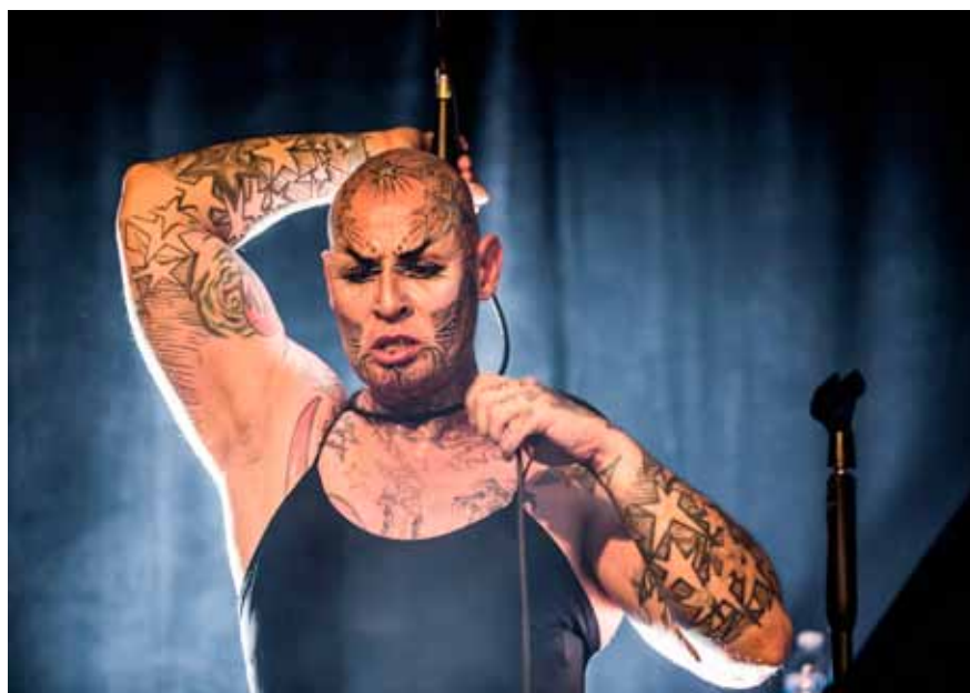
Jean Luc Verna I Apologize