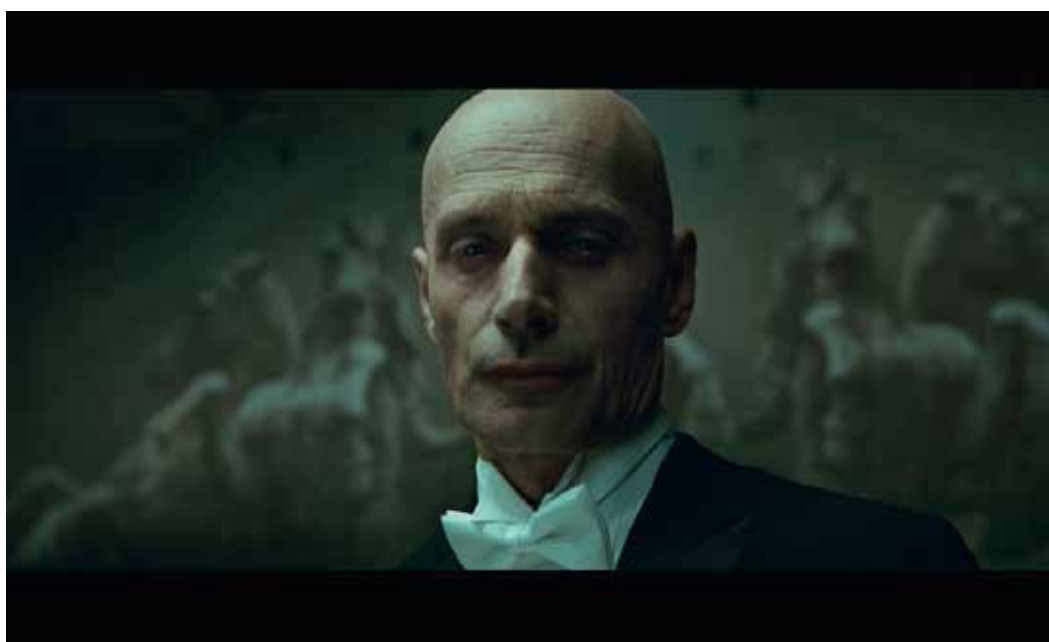
Denis Villeneuve Next Floor , 2008, film 35mm, 11min34.

VERNISSAGE MARDI 30 SEPTEMBRE 2014 À PARTIR DE 18 H PRÉSENTATION PRESSE MARDI 30 SEPTEMBRE À 14 H 30