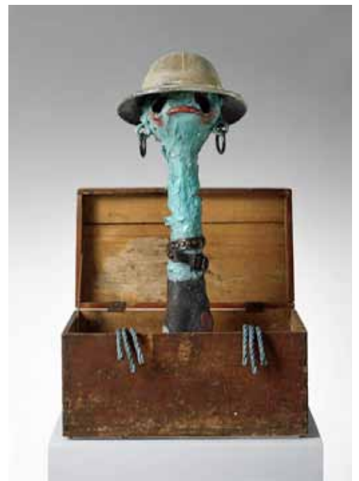
Uwe Henneken V.O.T.E # 2307-2 , 2008 Sculptures en bronze et boîtes en bois 89 x 54 x 36 cm